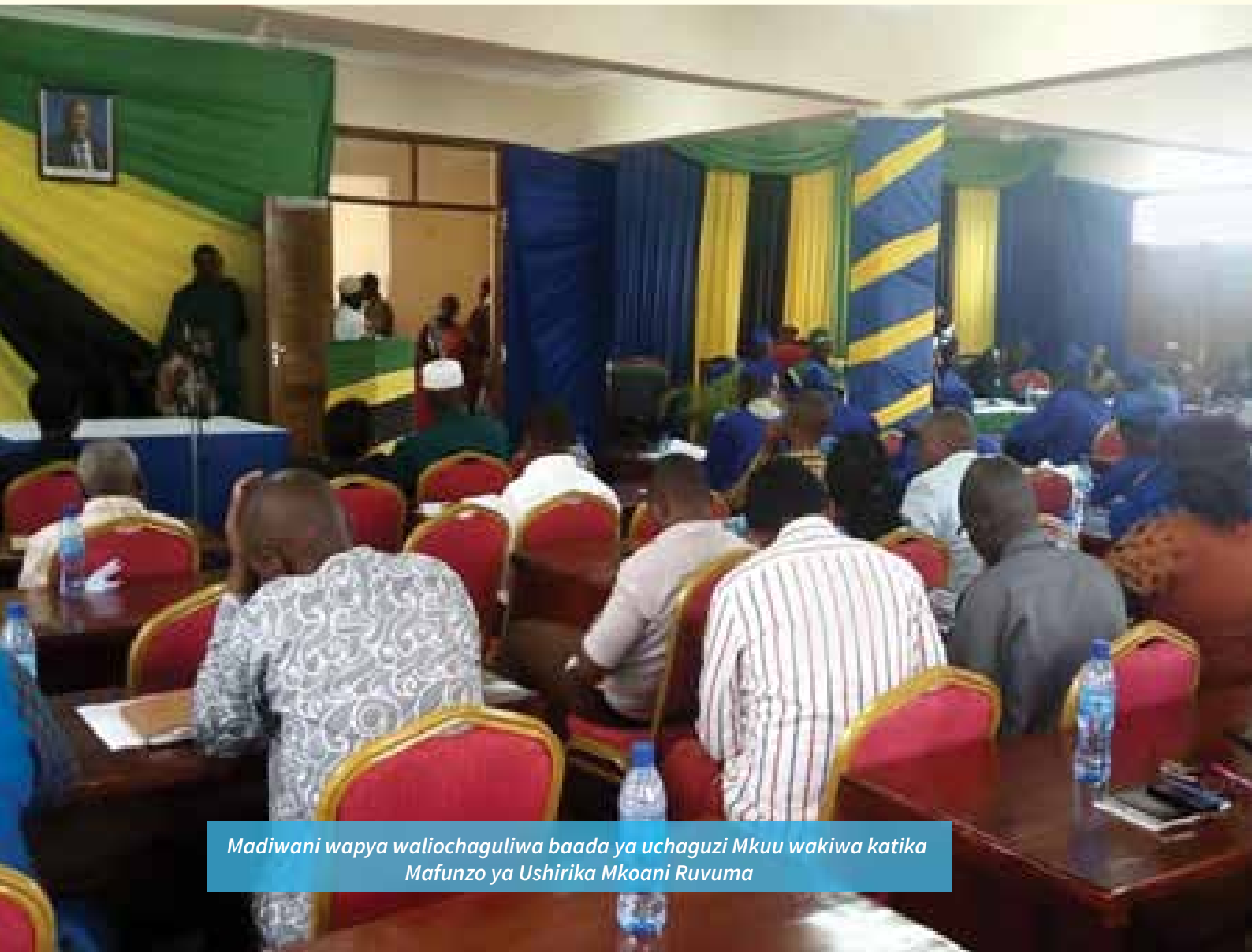
Madiwani wanya waliochaguliwa baada ya uchaguzi Mkuu wakiwa katika Mafunzo ya Ushirika Mkoani Ruvuma

Miongoni mwa masuala yaliyoelekezwa katika mafunzo hayo ni pamoja na Misingi ya Ushirika Kimataifa ikiwemo Uanachama wa hiari, demokrasia, Ushiriki wa wanachama katika shughuli za Kiuchumi, Uhuru na kujitegemea na Elimu, mafunzo na taarifa, Ushirikiano miongoni mwa Vyama vya Ushirika pamoja na kujali Jamii.