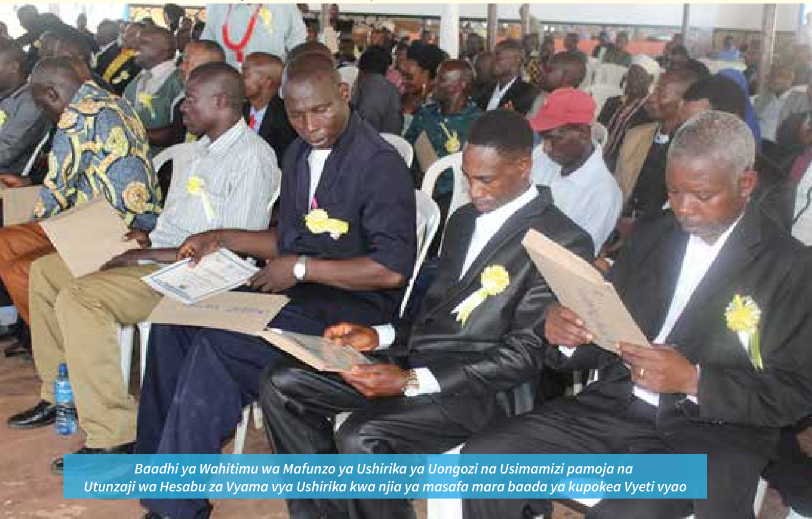
Baadhi ya Wahitimu wa Mafunzo ya Ushirika ya Uongozi na Usimamizi pamoja na Utunzaji wa Hesabu za Vyama vya Ushirika kwa njia ya masafa mara baada ya kupokea Vyeti vyao