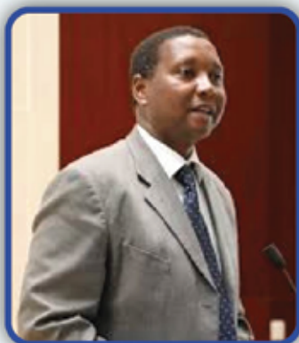
Mhe. Prof. Adolph F. Mkenda Waziri wa Kilimo