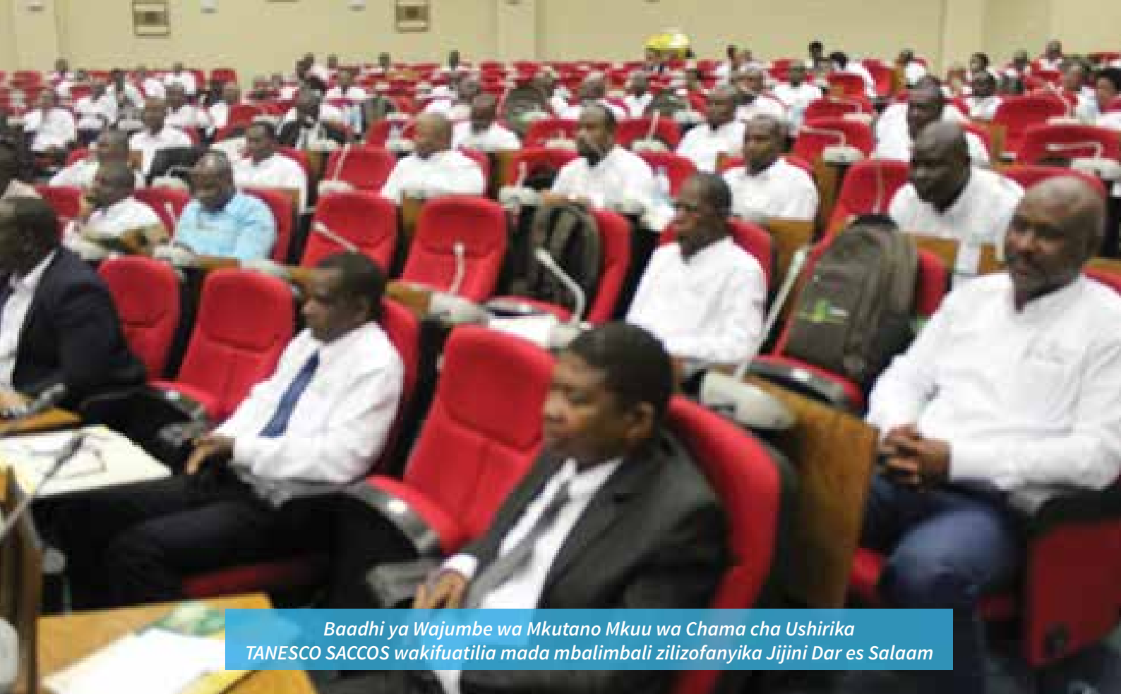
Baadhi ya Wajumbe wa Mkutano Mkuu wa Chama cha Ushirika TANESCO SACCOS wakifuatilia mada mbalimbali zilizofanyika Jijini Dar es Salaam