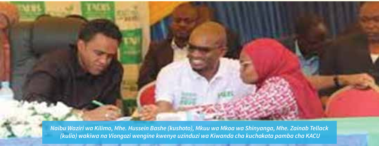
Naibu Waziri wa Kilimo, Mhe. Hussein Bashe (kushoto), Mkuu wa Mkoa wa Shinyanga, Mhe. Zainab Tellack (kulia) wakiwa na Viongozi wengine kwenye uzinduzi wa Kiwanda cha kuchakata pamba cha KACU

Chama Kikuu cha Ushirika Chato - CCU ltd kilinunua jumla ya kilo 4,312,680 za pamba kwa bei ya wastani wa sh 900/= kwa kilo zikiwa na thamani ya sh. 3,881,412,000/= kutoka katika Halmashauri za Chato, Biharamulo, Geita na Muleba.