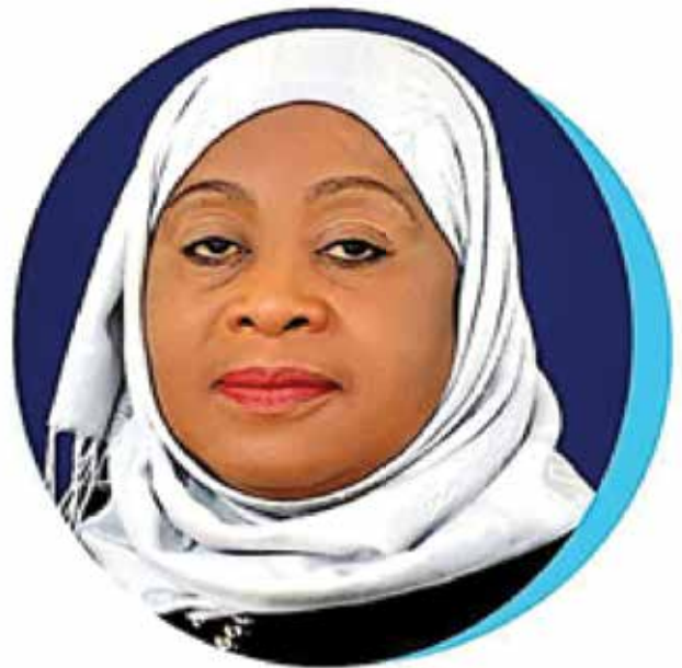
Mhe. Samia Suluhu Hassan

Tume ya Maendeleo ya Ushirika Tanzania (TCDC) inapenda kumpongeza Rais, Mhe. Dkt. John Pombe Magufuli na Makamu wa Rais, Mhe. Samia Suluhu Hassan kwa ushindi na kuweza kutetea kiti cha Urais katika Uchaguzi Mkuu uliofanyika Oktoba 2020.