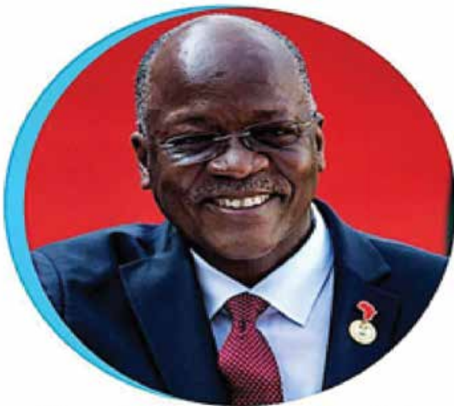
Mhe. Dkt. John Pombe Magufuli