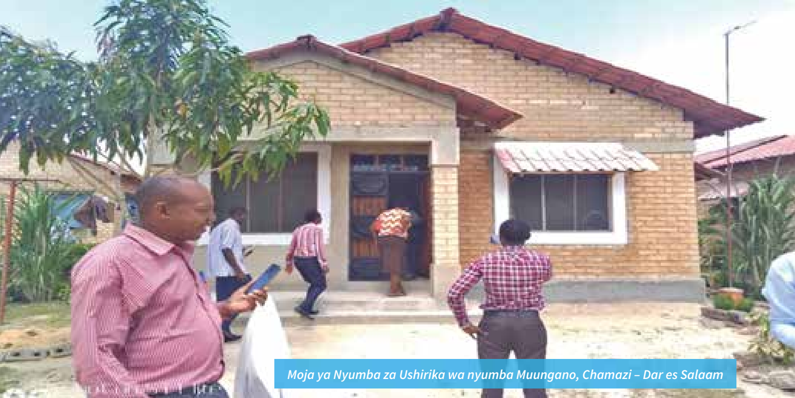
Moja ya Nyumba za Ushirika wa nyumba Muungano, Chamazi – Dar es Salaam

Bidhaa na huduma zinazoweza kutolewa na Vyama vya Ushirika wa Nyumba ni kama vile: kujenga nyumba za wanachama za kuishi; nyumba za kupangisha; kuwapa wanachama wake mikopo ya vifaa vya ujenzi kama vile saruji, mabati na mbao, ambapo wanachama wanaweza kuwa wanalipa kidogo kidogo kwa muda maalumu na kwa kufuata utaratibu waliojiwekea; kutoa mikopo ya kuwezesha wanachama wake kununua nyumba ambazo tayari zimekamilika; kusaidia wanachama kupata mikopo kwa ununuzi wa viwanja vya ujenzi wa nyumba; kutoa mikopo ya ukarabati wa nyumba; na kutoa mikopo ya ujenzi wa miundombinu ya nyumba kama vile kuweka umeme, maji na kuboresha mfumo wa maji taka. Ili chama kiweze kutoa huduma kwa ufanisi, inabidi kiweze kuwa na fedha za kutosha. Hivyo, mfumo mmojawapo ni kuwa na Mfuko wa ujenzi wa Nyumba za gharama nafuu.