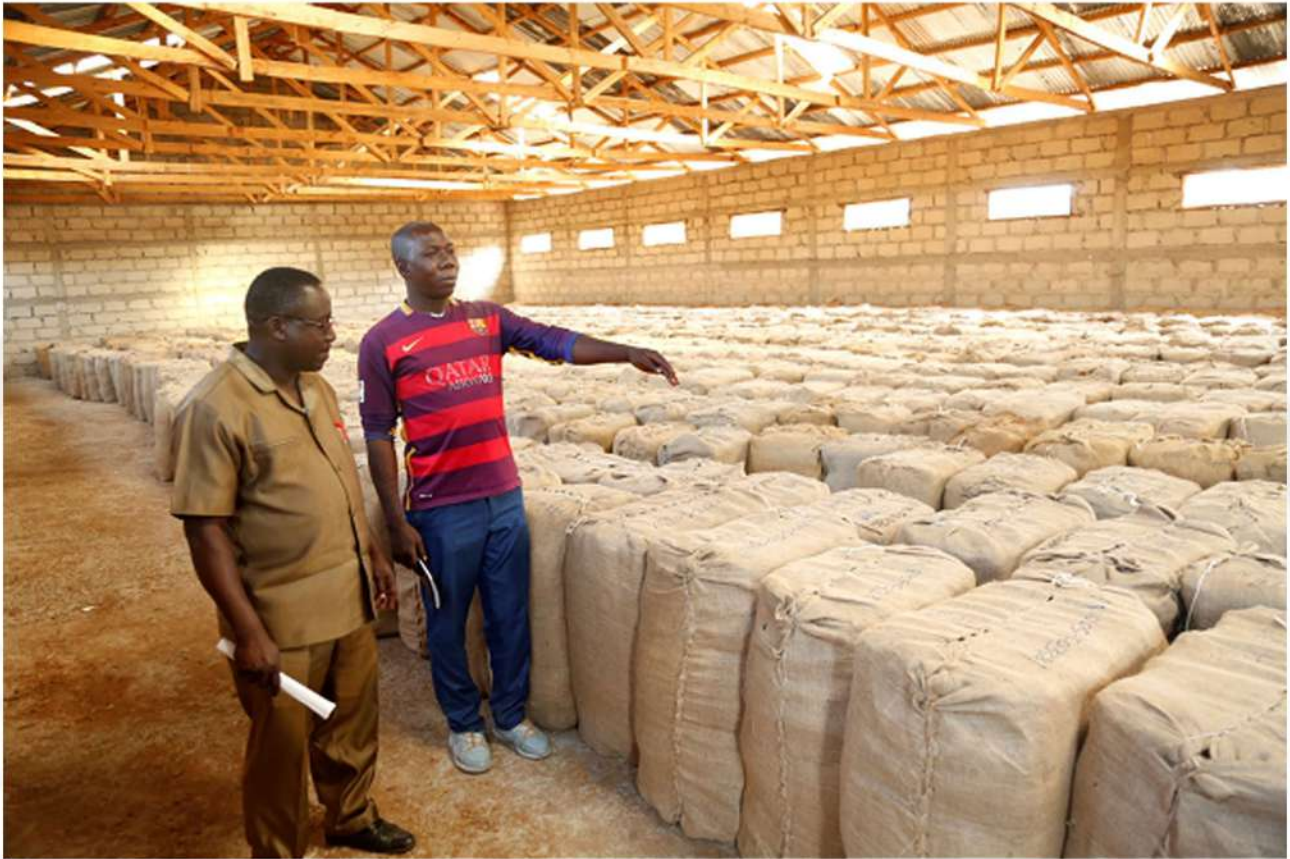
Mrajis Msaidizi Mkoa wa Katavi, Kakozi Amri (kushoto) akikagua ghala la Chama cha msingi cha Ushirika Ilunde AMCOS lenye uwezo wa kuhifadhi magunia yenye tumbaku 2,000 kwa wakati mmoja

C hama Kikuu cha Ushirika cha wakulima mkoani Katavi (LATCU Ltd) kilianzishwa mwaka 1994 na mpaka sasa kina vyama vya Ushirika vya msingi wanchama kumi na moja (11) ambavyo ni Mpandakati AMCOS, Nsimbo AMCOS, Katumba AMCOS, Kasokola AMCOS, Majalila AMCOS, Ukonongo AMCOS, Ilunde AMCOS, Mishamo AMCOS, Tanganyika AMCOS, Ilela AMCOS na Utense AMCOS. Aidha vyama vya Kasekese na Kamwendwe vimeomba kujiunga na chama kikuu na vinasubiri kupata ridhaa ya wanachama katika Mkutano Mkuu wa LATCU Ltd.