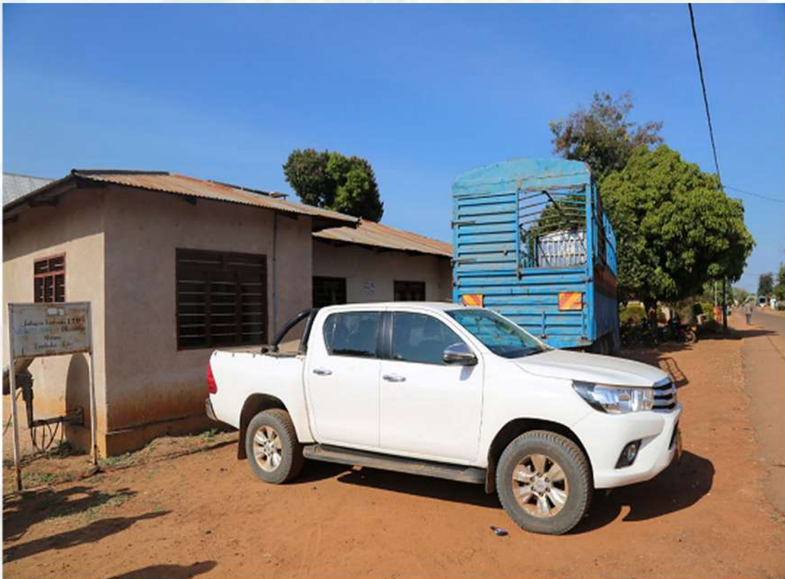
Gari aina ya Toyota Hilux lililonunuliwa na Chama Kikuu kwa kushirikiana na Vyama vya Ushirika wanachama wa LATCU linalosaidia Ofisi ya Mrajis Msaidizi (M) - Katavi kufanya majukumu ya ushirika.