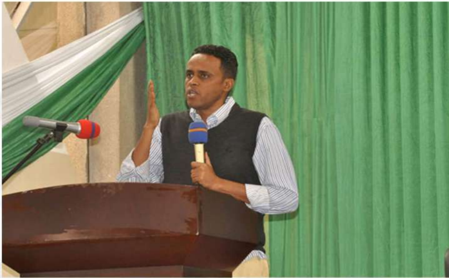
Naibu Waziri wa Kilimo Mhe. Hussein Bashe akielekeza mikakati ya kuimarisha Ushirika wakati wa kikao cha Makamishna wa Tume ya Maendeleo ya Ushirika

V yama vya Ushirika vimeagizwa kujiendeshe kibiashara kwa kutumia misingi dhabiti ya Ushirika pamoja na matumizi mazuri ya rasilimali zilizopo katika Sekta ya Ushirika ili kutengeneza faida na manufaa kwa Wanaushirika na hatimaye kuongeza pato la Taifa.