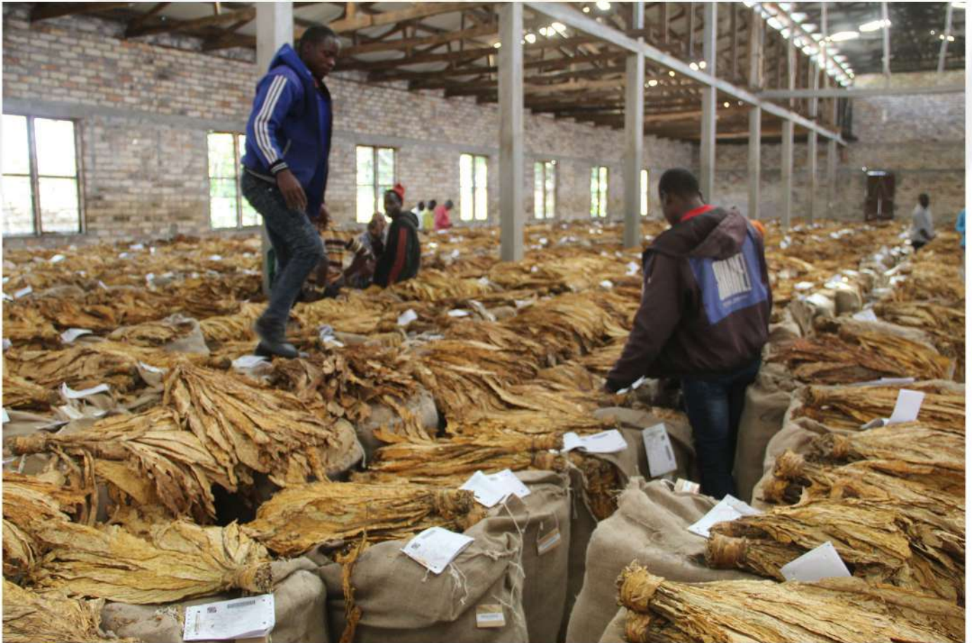
Madaraja ya Tumbaku yaliyopangwa tayari kwa mauzo katika ghala lililopo Wilaya ya Chunya Mkoani Mbeya

Charahani amesema matarajio ya kitaifa ni kuzalisha kilo milioni 57 za tumbaku ambazo zinauzwa sasa, hii ikiwa imetokana na hali ya hewa mwaka huu ya mvua nyingi zilizosababisha mbolea kupotea ardhini. Aidha Mwenyekiti Charahani ameipongeza Serikali ya Awamu ya Tano kwa jinsi inavyoendesha na kusimamia shughuli mbambali za kilimo kwa kutetea maslahi ya watu wanyonge. Aliongeza pongezi mahususi kwa Serikali kuondoa baadhi ya tozo na kodi za tumbaku ambazo zitasaidia kujenga hoja zenye nguvu katika kujadiliana bei ya tumbaku.