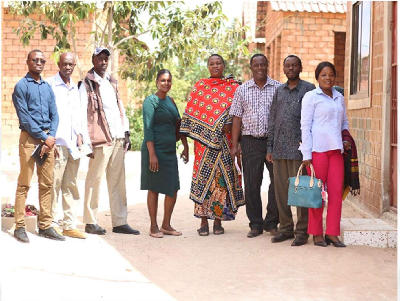
Wajumbe wa Kikao katika picha na Wajumbe wa Sejeseje HCS

N yumba ni moja ya mahitaji muhimu ambayo kila binadamu anahitaji ili aweze kuishi akiwa na afya njema na kumpatia hifadhi yenye usalama. Kuishi katika nyumba bora humfanya mtu awe na afya njema na humwezesha atoe mchango mkubwa katika shughuli za uzalishaji mali. Uhamiaji wa watu wengi kutoka katika maeneo ya vijijini kwenda mijini umesababisha kuongezeka kwa matatizo ya nyumba hasa maeneo ya mijini. Kwa kuzingatia hili, vyama vya ushirika wa nyumba vimepewa msukumo mkubwa ili kuwezesha wananchi kupata nyumba bora na kupunguza matatizo ya nyumba hasa maeneo ya mijini.