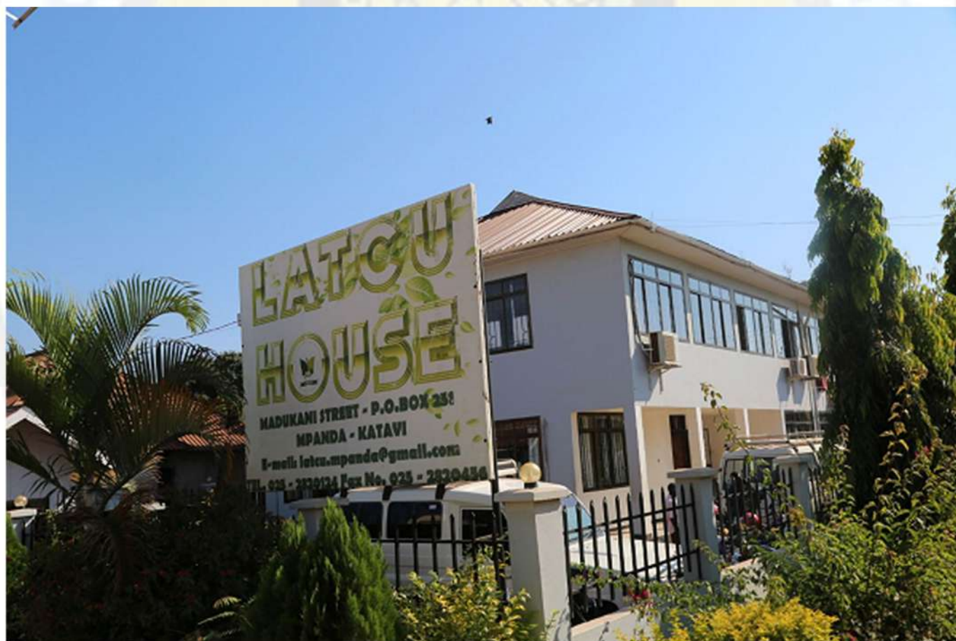
Makao makuu ya Chama Kikuu cha Ushirika cha wakulima mkoani Katavi (LATCU Ltd)

Kasokola AMCOS kimepata mafanikio makubwa tangu kuanzishwa kwake, mafanikio hayo ni pamoja na: kukopa mikopo ya pembejeo na Cash Advance kwa misimu Mitano (5) na kurejesha mikopo hiyo kwa asilimia 100 kila msimu; kupata jengo la ofisi lenye thamani ya Shilingi 59,705,000; kuwa na shamba la miti la hekari 15 lenye thamani ya Shilingi 5,800,000; kutoa ajira za kudumu na mikataba kwa wakazi wa eneo husika; kujenga majiko ya kisasa na mabani na kuwezesha wanachama kuwa na mashamba ya pamoja ya miti kwa kila kijiji; na chama kimeongeza mazao mengine kama Pamba, Alizeti na Ufuta.