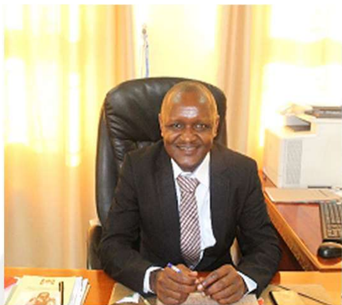
Dkt. Benson Ndiege Mrajis wa Vyama vya Ushirika na Mtendaji Mkuu wa Tume ya Maendeleo ya Ushirika