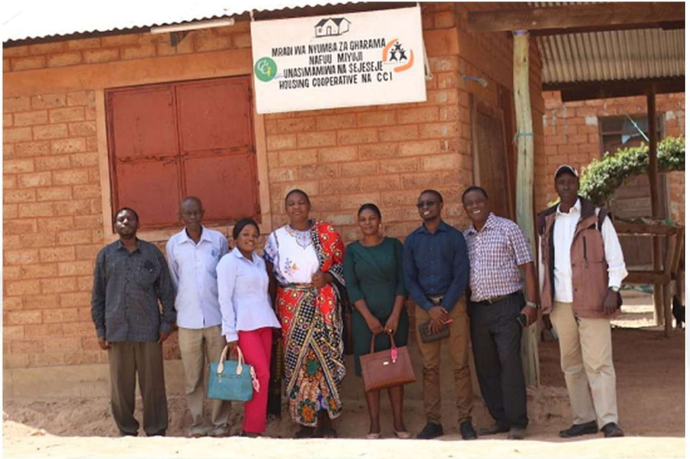
Wajumbe nje ya Ofisi ya Sejeseje H.C