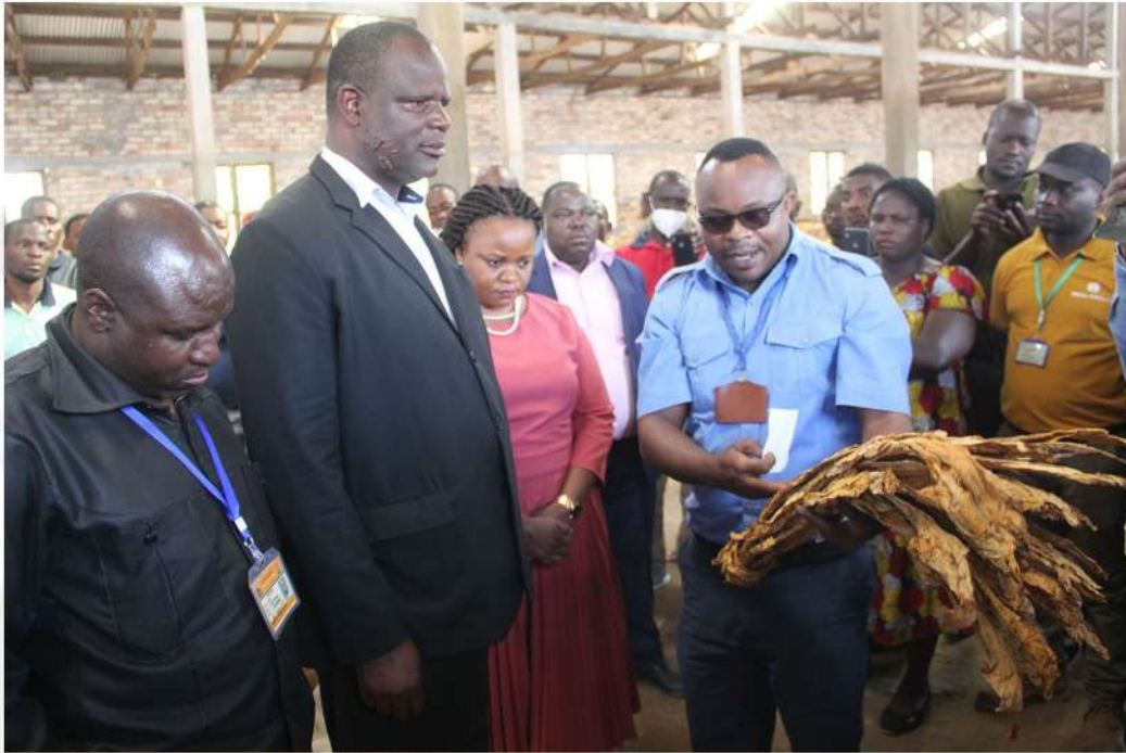
Waziri wa Kilimo Mhe. Japhet Hasunga (wa pili kushoto) akioneshwa madaraja ya Tumbaku wakati wa uzinduzi rasmi wa masoko ya minada ya Tumbaku wa mwaka 2020/21 wilaya ya Chunya Mkoani Mbeya

W aziri wa Kilimo Mhe. Japhet Hasunga ametoa wito kwa wakulima nchini kuwa na Vitambulisho ili kurahisisha upatikanaji wa taarifa za mkulima kwa urahisi kama vile aina ya kilimo anachofanya, eneo analotoka, mazao anayolima na taarifa nyingine muhimu za utambulisho wake. Aliyasema hayo wakati wa hafla ya uzinduzi rasmi wa masoko ya minada ya Tumbaku wa mwaka 2020/21 uliofanyika Wilaya ya Chunya Mkoani Mbeya. Akifungua masoko hayo Waziri alisisitiza kuwa ni muhimu wakulima kuwa na vitambulisho kwani kilimo ni moja ya Sekta muhimu za uchumi wa Taifa letu kutokana na kilimo kuchangia pato la Taifa pamoja na asilimia 30 ya fedha za kigeni kwa mahitaji yakibiashara, ajira, chakula, na malighafi za viwandani.