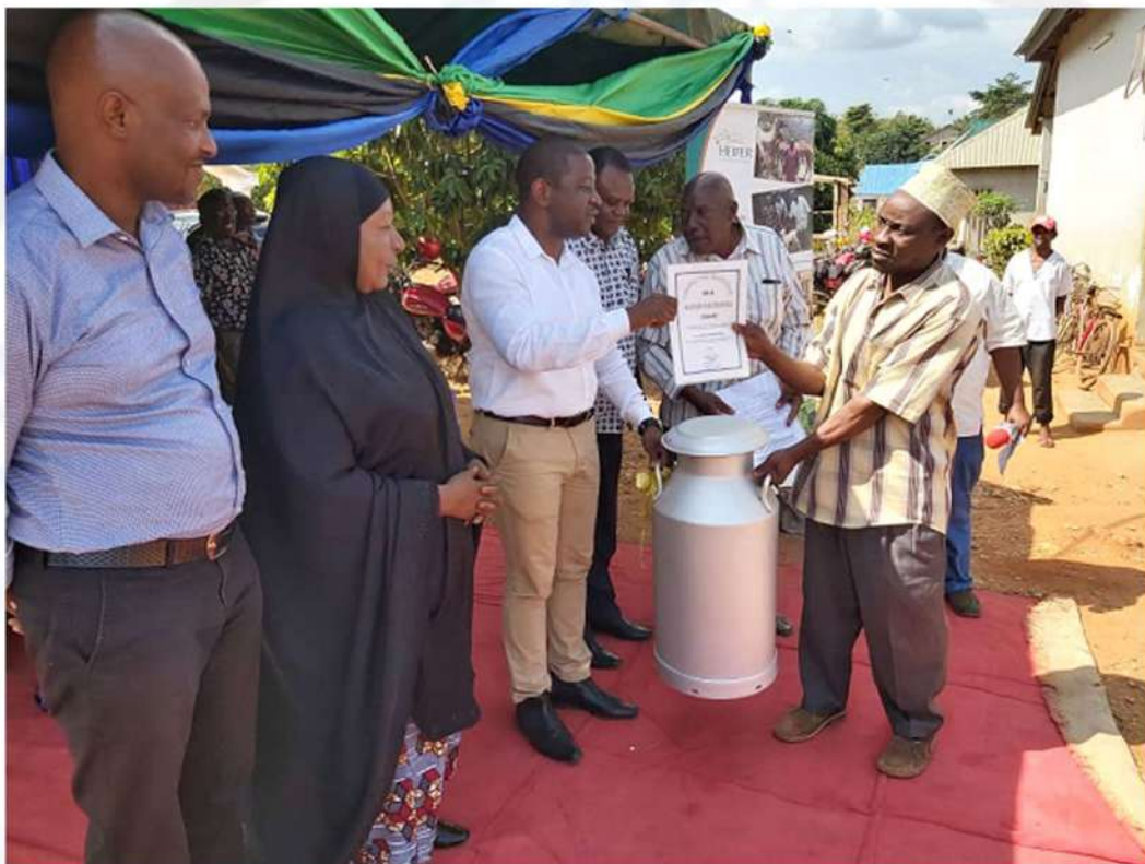
Naibu Waziri wa Mifugo na Uvuvi, Mhe. Abdallah Ulega akikabidhi vibebea maziwa (cans) 50 kwa Wanaushirika wa Chama Kikuu cha wafugaji Mkoani Tanga (TDCU) kwa ajili ya ubebaji maziwa

na changamoto alizojionea, Mhe. Ulega alielekeza Wataalam wa Sekta Binafsi kukaa na TADB kutoa mwelekeo wa nini kifanyike kwa Wafugaji waliopata hasara kutokana na ng'ombe walikopeshwa kutokutoa maziwa.