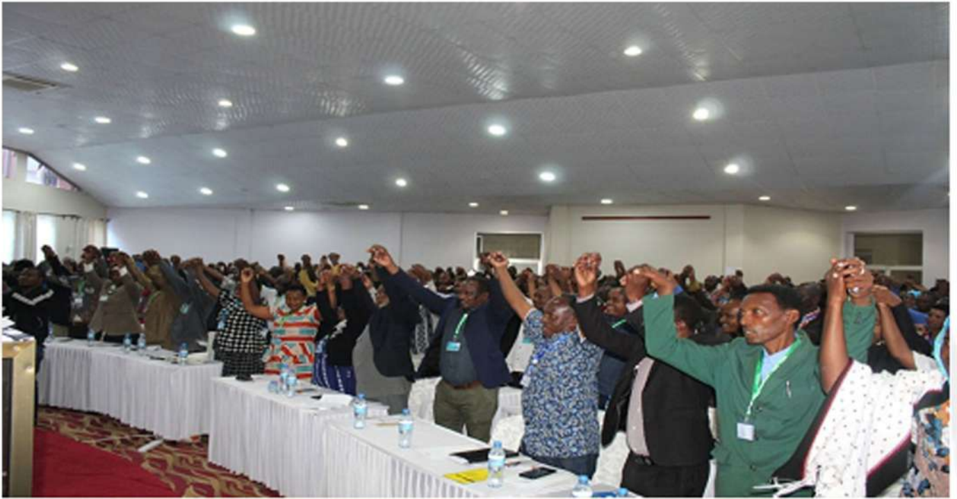
Pichani ni wanachama wa SCCULT (1992) LTD wakiwa kwenye mkutano mkuu wa 22, Jijini Arusha