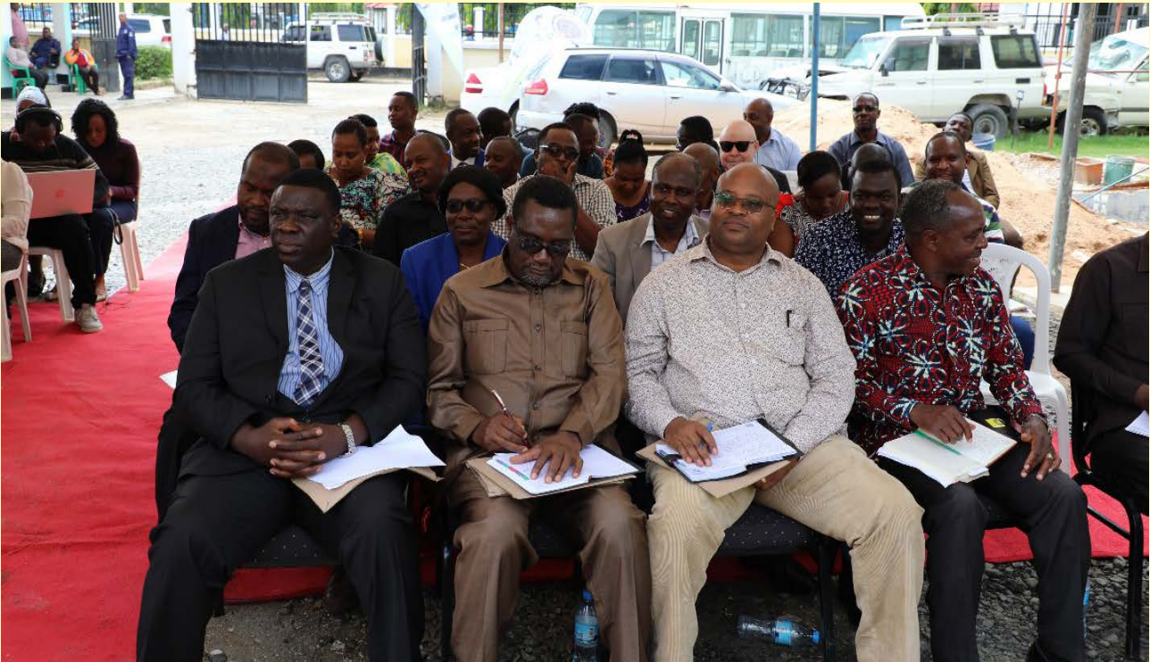
Warajis Wasaidizi wa Vyama vya Ushirika Tanzania Bara wakimsikiliza Waziri wa Kilimo, Prof. Adolf Mkenda (hayupo pichani) Jijini Dodoma, Januari 2021

- Kuendelea Kuwabana Wezi na Wabadhirifu wa mali za Ushirika