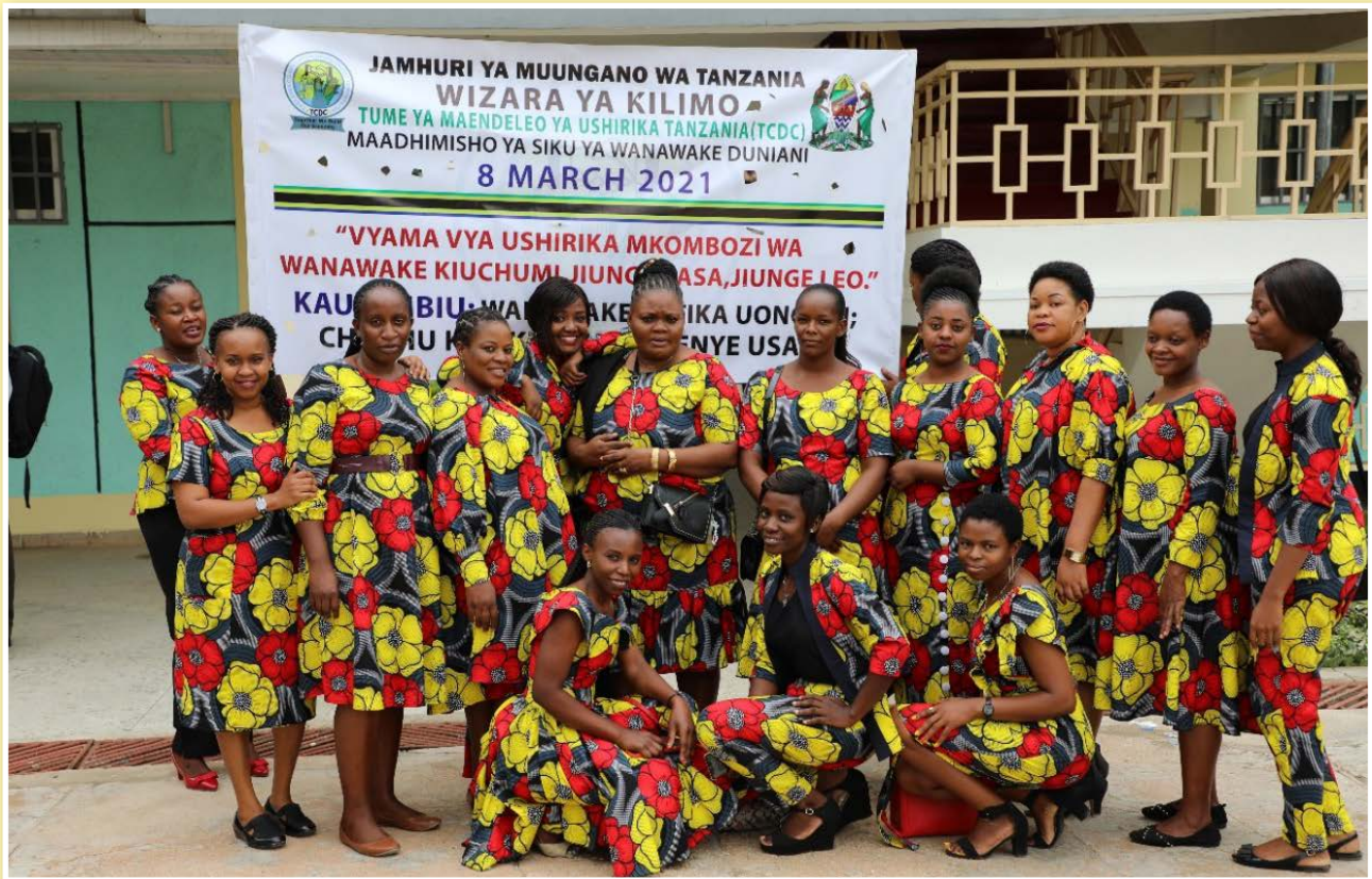
Watumishi Wanawake wa Tume ya Maendeleo ya Ushirika katika Picha ya Pamoja wakati wa maadhimisho ya Siku ya Wanawake Duniani, Jijini Dodoma