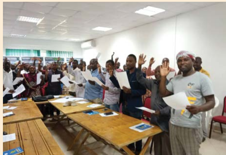
Wajumbe wa Bodi za Vyama vya Ushirika Ushirika vya Wakulima wa Miwa kutoka Kagera, Mtibwa, Kilosa, Kilombero na Mbigiri (Magore) wakiapa kiapo cha Uadilifu kabla ya kuanza majukumu yao ya kazi katika Vyama vyao vya Ushirika

kutoka COASCO Tanga kwa lengo la kuongeza wigo wa ufanisi katika utendaji. Wajumbe katika mafunzo hayo walipata Elimu ya Ushirika kwenye maeneo mbalimbali kama vile Dhana ya Ushirika, Utawala Bora na Maadili, Utatuzi wa Migogoro, Masuala ya Kodi, Uandaaji na Udhhibiti wa bajeti, Masuala ya Rushwa kwenye Vyama vya Ushirika, huduma kwa wanachama, uandaaji wa makisio, ukomo wa madeni, kupanga mpango mkakati, ununuzi na Itifaki.