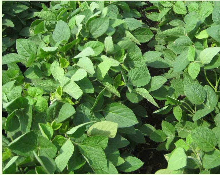
Soya ikiwa shambani