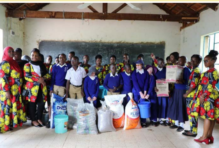
Wanawake wa Tume ya Maendeleo ya Ushirika wakiwa pamoja na wanafunzi wa Shule ya msingi Buigiri baada ya kukabidhi mahitaji mbalimbali katika Maadhimisho ya Siku ya Wanawake Duniani Machi 8, 2021.