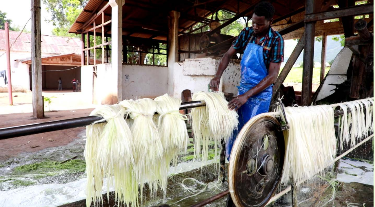
Mfanyakazi katika Kiwanda cha kusindika mkonge akiwa katika uandaaji wa Katani katika mtambo wa Korona kilichopo Wilaya ya Korogwe Mkoani Tanga

Vyama vya Ushirika vya mazao vina uwezo wa kuwa na viwanda vingi kuliko Taasisi nyingine yoyote kutokana na kwamba zaidi ya asilimia 70 ya mali ghafi za viwanda zinazalishwa na kuuzwa kupitia vyama vya ushirika. Kwa mfano mazao ya Korosho, Pamba, Tumbaku, Chai, Mkonge na Kahawa yanazalishwa na kuuzwa kupitia mfumo wa Vyama vya Ushirika.