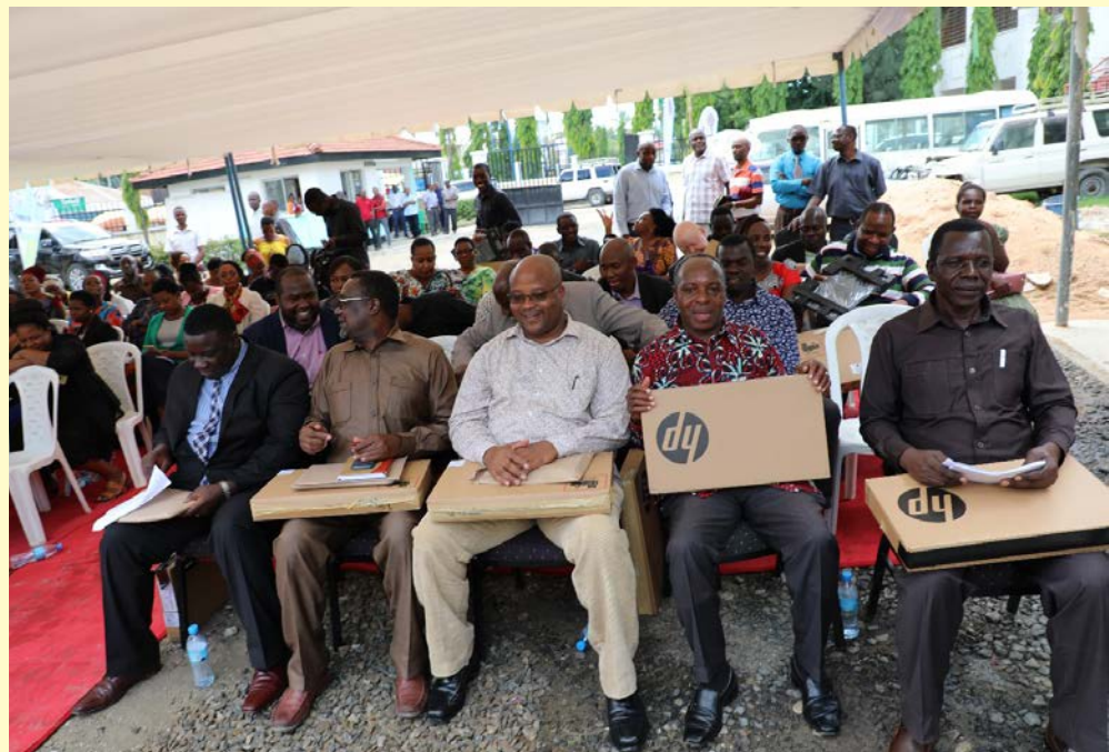
Warajis Wasaidizi wa Mikoa Tanzania Bara mara baada ya kukabidhiwa kompyuta mpakato na Waziri wa Kilimo, Prof. Adolf Mkenda, mwezi Januari 2021, Jijini Dodoma