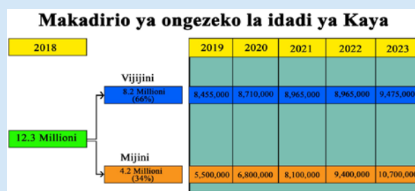
Ongezeko la Idadi ya Kaya

Mwaka 2018, Tanzania ilikuwa na kaya milioni 12.3. Kati ya hizo kaya milioni 8.2 (66%) zilikuwa za Vijijini na milioni 4.2 (34%) zilikuwa za mijini. Kutokana na taftiti hiyo ya Pienaar (2020), inakadiriwa kuwa katika kipindi cha miaka 5 ijayo, idadi ya Kaya katika maeneo ya vijijini itaongezeka kwa kaya 255,000 kwa mwaka na kaya za mijini 1,300,000 kwa kila mwaka. Kutokana na makadirio haya, idadi ya kaya inaweza kuongezeka kama ifuatavyo:-