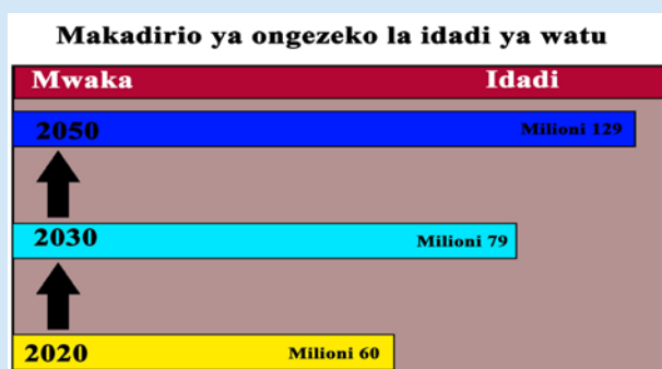
Makadirio ya Idadi ya Watu Mijini

Utafiti uliofanywa na Pienaar, (2020) unaonyesha kuwa, Tanzania inakadiriwa kuwa na idadi ya watu milioni 60 ifikapo mwishoni mwa mwaka 2020. Kiwango cha ukuaji ni zaidi ya 3% kwa mwaka inakadiriwa kuwa, kufikia mwaka 2030 idadi ya watu nchini Tanzania itaongezeka na kufikia zaidi ya watu milioni 79. Na ifikapo mwaka 2050, inakadiriwa kuwa idadi ya watu itafikia zaidi ya milioni 129. Ongezeko hili linaenda sambamba na ukuaji wa mahitaji ya makazi / Nyumba