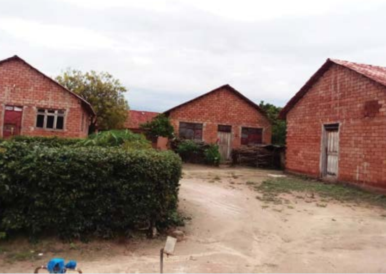
Baadhi ya nyumba za Wanachama wa Chama cha Ushirika wa nyumba Sejeseje kilichopo Jijini Dodoma