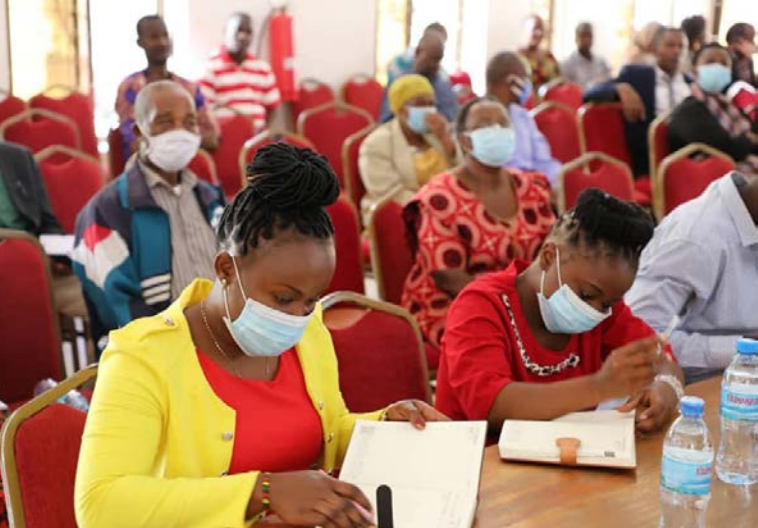
Viongozi Wapya wa Bodi za Uongozi na Kamati za Usimamizi wa Vyama vya Ushirika wakiwa katika mafunzo elekezi Mkoani Kilimanjaro