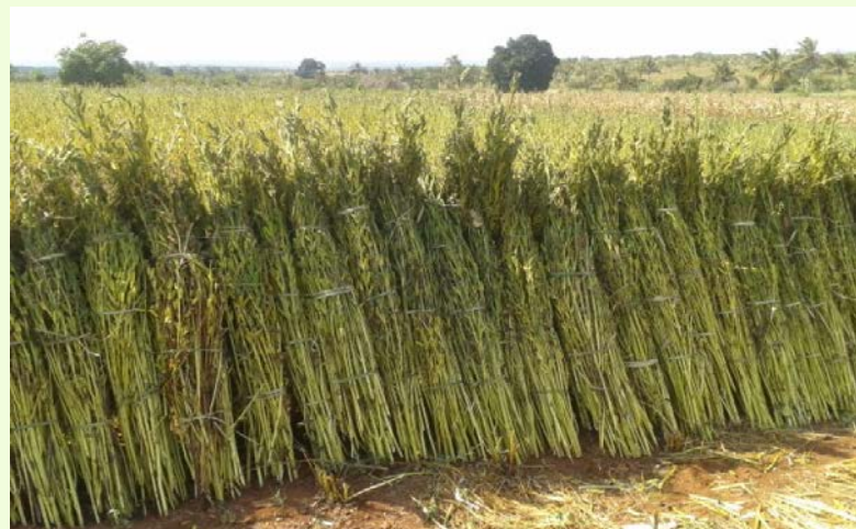
Mavuno ya zao la Ufuta

Pamoja na mafanikio yaliyojitokeza, mambo yafuatayo yanapaswa kuzingatiwa: